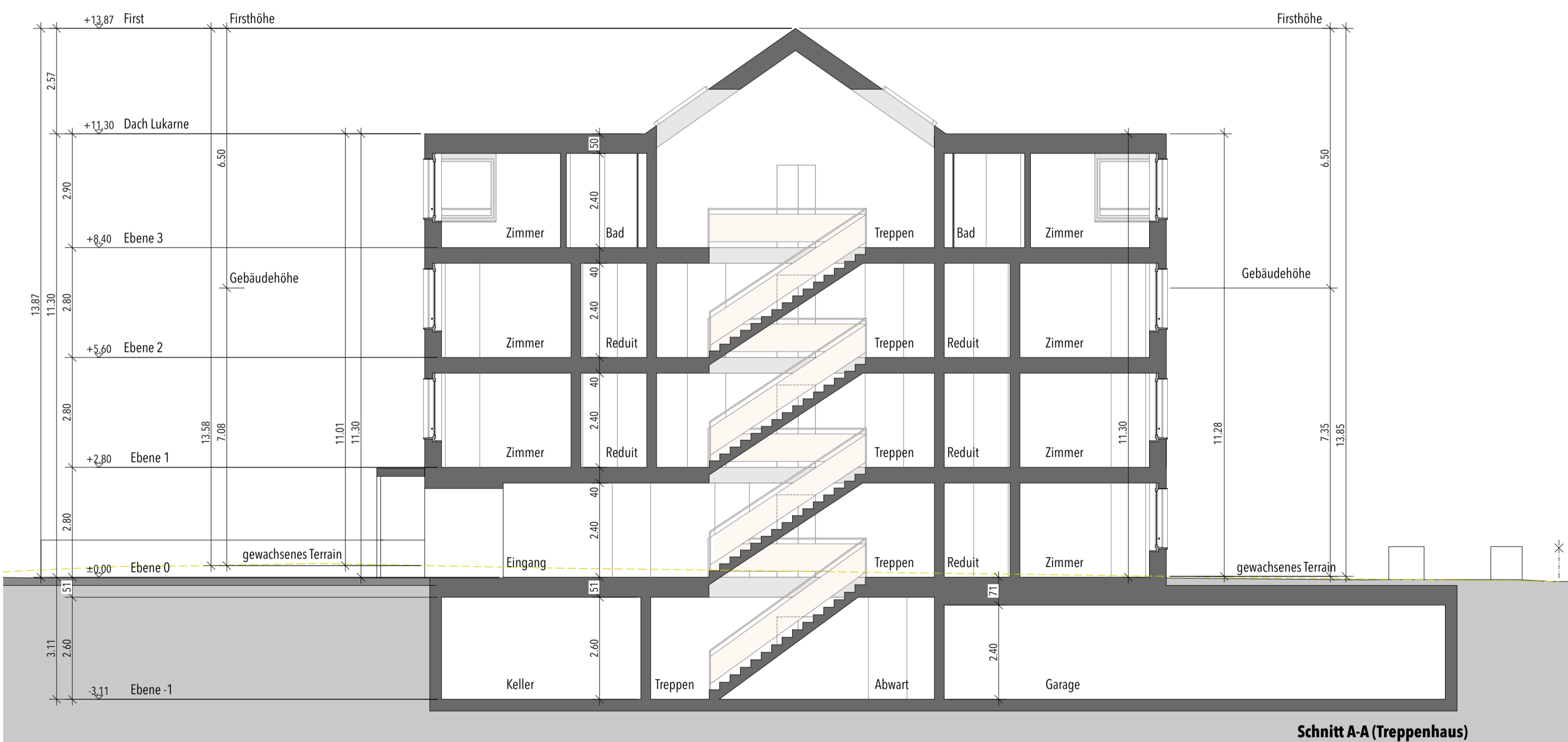
Schnitt A-A (Treppenhaus)